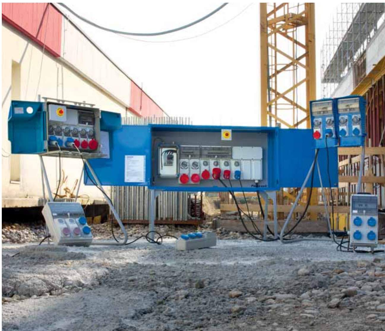
CUADROS ASC DE DISTRIBUCIÓN Y TRANSFORMACIÓN